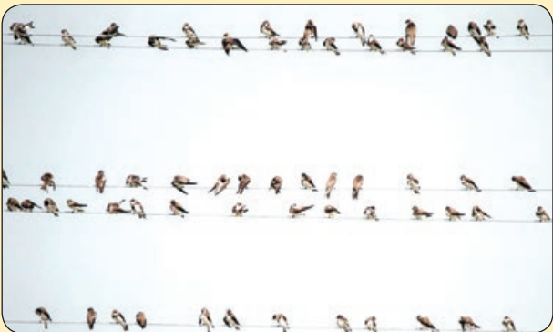
یاهو! پرندگان مهاجر