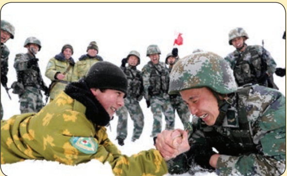
بارکرافت| زورآزمایی نیروهای نظامی چین و تاجیکستان در مانور مشترک

یاهو - مزرعه‌ای در سوئد وجود دارد که در سال فقط ۳۰۰ کیلوگرم پنیر از شیر گوزن تولید می‌کند. این نوع پنیر بالاترین میزان پروتئین را دارد و دارای بافتی صاف و طعمی اسیدی است. این پنیر با نام «موس» از شیر سه گوزن شمالی به نام‌های «گولان، جونو و هالگا» در ست می‌شود که توسط مادرشان رها شده و مالک این مزرعه از آن‌ها نگهداری می‌کند. هر یک از این گوزن‌ها روزانه ۵ لیتر شیر می‌دهند، یعنی در سال فقط ۳۰۰ کیلوگرم از این پنیر تولید می‌شود و قیمت هر کیلوی آن حدود ۱۰۰۰ دلار (تقریباً ۱۴ میلیون تومان) است.