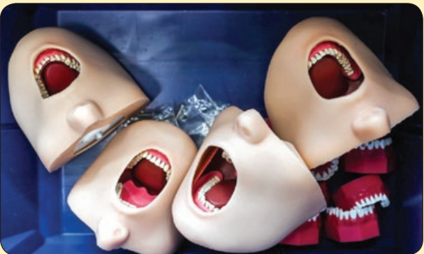
تاس! دهان شبیهه سازی شده برای انجام معالجات دندان پزشکی، روسیه