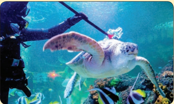
پاک سازی آکواریوم و موجودات داخلش توسط غواصان، آلمان

• تبلی چشم چه جوریه دقیقا؟ یعنی به چشم می گی این صفحه رو نگاه کن می گه: «نومو خوام اصن حسش نی؟!» • ۴ تا دونه وسیله می خری، اون قدر باید عدد و رقم بزنی رو دستگاه کار تخوان که از کت و کول می افتی! • پدر بزرگ رفیقم مرده بود اودم با شخصیت بازی در بیارم بگم مرگ حقه، گفتم حقش بود، گفت داداش خفه شو برو خر ماتو بخور! • اولین فردی که صفر رو وارد اعداد کرد خوار می بود، منم با نمبره هایی که در طول زمان تحصیل گرفتم، به گسترش این اختراع کمک شایانی کردم! • یه زمانی یخچال ها اون قدر پر بود اسم شون رو گذاشته بودیم اتاق فکر، باز می کردی نمی دونستی چی بخوری. الان اون قدر خالی هستن که میشه جای کمد از شون استفاده کرد! • کاش آلام گوشی شعور داشت و بر اساس خستگی کوک می شد و زنگ می زد، خودشم جواب رئیس مون رو می داد!