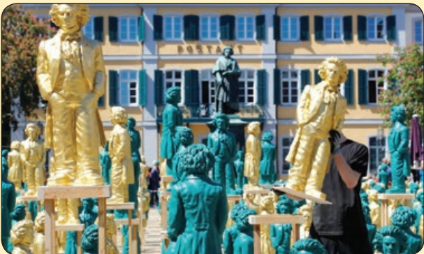
رویترز| آماده سازی مجسمه های پلاستیکی پنهون برای جشن تولد ۲۵ سالگی این آهنگ ساز در زادگاهش، آلمان

با من بیا به رویاهام برایت رویایی کشیدم از جنس دریا چشمانت خود دریاست همان قدر بی پایان بنشین بر ساحل این دل