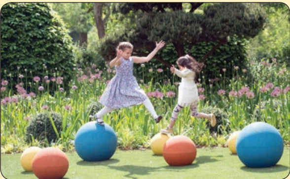
تلگراف | باغ کودک کان، انگلستان