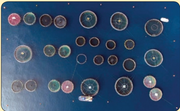
گتی |محل تجمع ماهی گیران، ترکیه

چمن حکایت از دیبهبشت می گوید نه عاقل است که نسپه خرد و نقد بهبشت به می عمارت دل کن که این جهان خراب بر آن سراسر است که از خاک ما بسازد خشت