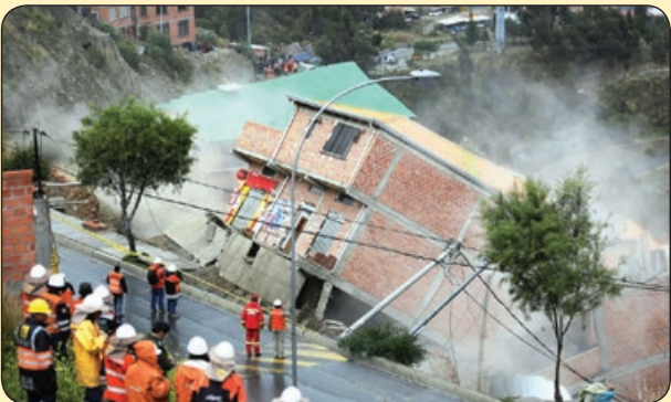
رانش زمین بر اثر بارش باران، بولیوی