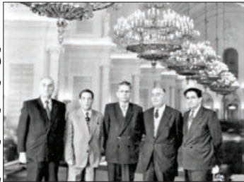
سران حزب توده در مسکو

پس از برکناری رضاخان از قدرت و صدور فرمان عفو عمومی برای زندانیان سیاسی، از جمله کسانی که آزاد شدند، ۵۳ نفر از طرفداران و اعضای اصلی حزب کمونیست بودند. به گزارش پایگاه مؤسسه مطالعات تاریخ معاصر ایران، تعدادی از آن‌ها، پس از آزادی، در پی آن برآمدند که فعالیت تشکیلاتی خود را در قالب یک حزب نهادینه کنند. به این ترتیب، حزبی جدید با نام حزب توده که به تعبیر آبراهامیان، نامی بلندپروازانه داشت، در ۷ مهرماه ۱۳۲۰ تأسیس شد؛ حزبی که حمایت همسایه شمالی، یعنی شوروی را با خود داشت. فعالیت حزب در سال‌های پس از تأسیس و به‌ویژه در یکی دو دهه ابتدایی، با فراز و نشیب‌های گوناگونی همراه شد.