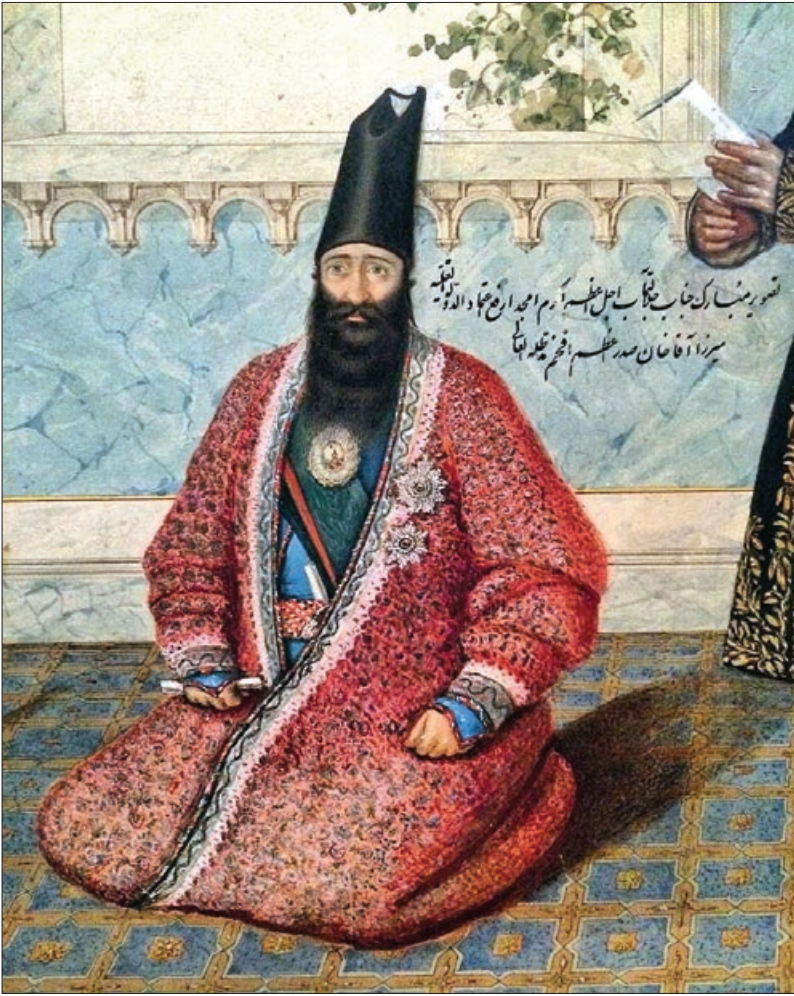
میرزا آقاخان نوری

■ رابطه با انگلیسی‌ها «محمود محمود» در جلد دوم کتاب «تاریخ روابط سیاسی ایران و انگلیس»، با استناد به برخی متون تاریخی مربوط به دوره قاجار، آشکارا از