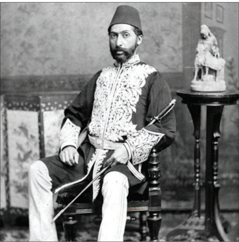
حسینقلی خان صدر السلطنه (حاجی واشنگتن)

میرزا آقاخان، جدایی‌هرات را که مقدمه‌ای بر جدایی کامل افغانستان از سرزمین ایران بود، پذیرفت و به آن، با امضای عهدنامه پاریس، جنبه رسمی داد. او حدود هفت سال، صدر اعظم ایران بود؛ دورانی که برخی از مورخان، آن را عصر تثبیت قدرت بریتانیا در ایران می‌دانند. اما برای میرزا آقاخان هم روی یک پاشنه نچرخید. هفت سال پس از شهادت امیرکبیر، شاه به او غضب و از صدارت خلعش کرد. میرزا آقاخان که به گفته کنت گوبینو، سفیر فرانسه در ایران، قصه‌گویی چیره‌دست بود، راه‌هم اصفهان را در پیش گرفت و سرانجام، در ۵۹ سالگی، درگذشت. پیکر او را به عتبات بردند و در مسجدی دفن کردند که از ثلث اموال امیرکبیر ساخته شده بود!