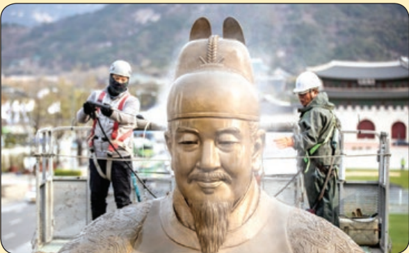
شست و شوی مجسمه، کره جنوبی