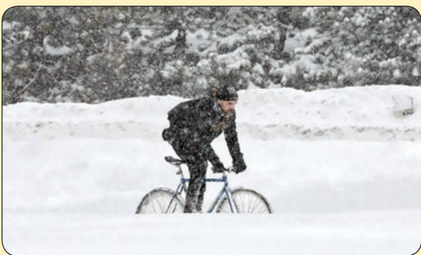
دوچرخه سواری در برف، کانادا

زیر باران نگاهت یک شب لرزه افتاد به اندام غزل های سپید اطلسی بود و هزاران عاشق شمعدانی، ناهید زیر باران نگاهت مُردَم... خاک گلدان میان پرچین خاک اندام من است