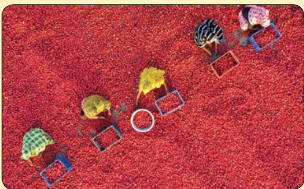
تلگراف | کارگران در حال پاک کردن گوجه فرنگی، بنگلادش

تویی که خوب تری ز آفتاب و شکر خدا که نیستی ز تو در روی آفتاب خجل حجاب ظلمت از آن بست آب خضر که گشت ز شعر حافظ و آن طبع همچو آب خجل