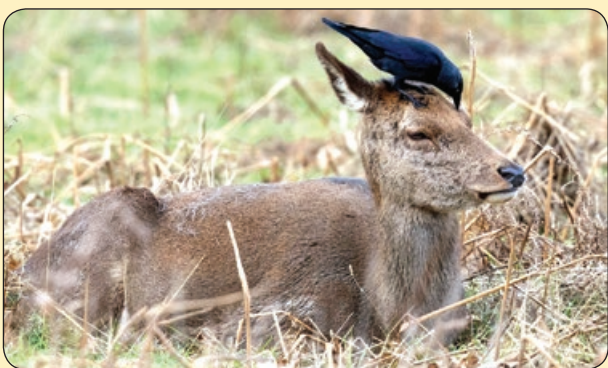
پی ای | همزیستی مسالمت آمیز!