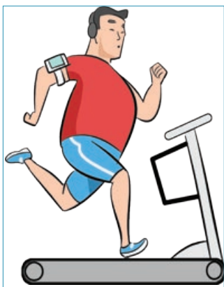
دویدن ۶۰۰ تا ۸۰۰ کالری در ساعت