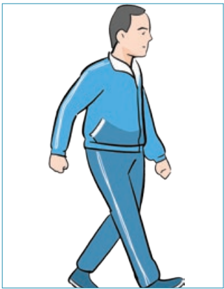
پیاده روی ۲۵۰ تا ۳۵۰ کالری در ساعت