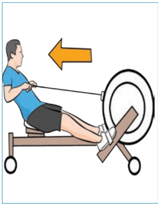
قایقی ۶۵۰ تا ۸۰۰ کالری در ساعت