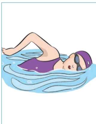
شنا ۴۰۰ تا ۸۰۰ کالری در ساعت