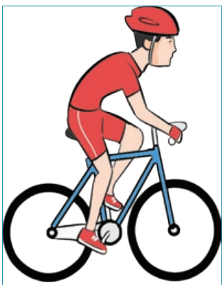
دوچرخه سواری ۶۰۰ تا ۱۰۰۰ کالری در ساعت

برای چربی سوزی بدن حرکات ورزشی زیادی پیشنهاد می‌شود، در ادامه این مطلب به ۸ حرکت ورزشی که باعث چربی سوزی می‌شود، اشاره می‌کنیم: