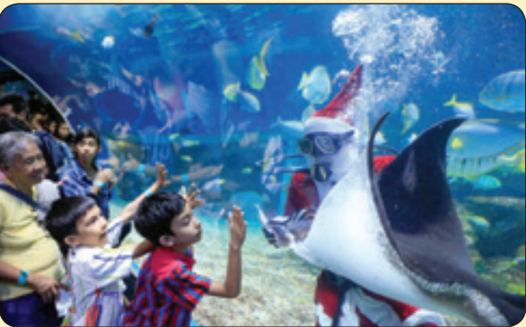
آکواریوم تفریحی، فیلیپین

آدیتی سنترال - خراب شدن بخشی از میوه‌ها بعد از جمع‌آوری و در مرحله توزیع، یک معضل است اما به نظر می‌رسد یک شرکت مالزایی این مشکل را برطرف کرده است. به‌طور میانگین ۵۲ درصد از میوه‌ها بعد از جمع‌آوری و قبل از این که به دست توزیع‌کننده برسد، از بین می‌رود. این شرکت بر چسبی روی میوه‌های تازه می‌زند که حاوی برخی مواد مغذی مورد نیاز میوه است و از خراب شدن آن به مدت دو هفته جلوگیری می‌کند.