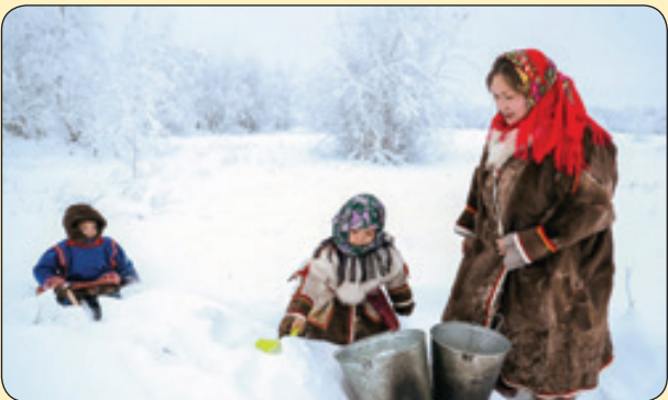
جمع کردن برف برای استفاده به عنوان آب در روستا، روسیه

پلک‌هایم خسته بود نزدیک بود که با قطره‌های باران بیامیزم بغضی، مرا در زلالی چشمانش تظاهر کرد