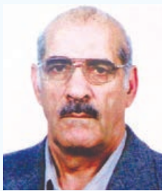
بادلی پر از درد، فراق مرحوم