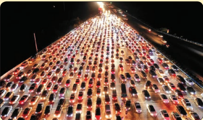
رویترز| ترافیک شبانگاهی، چین