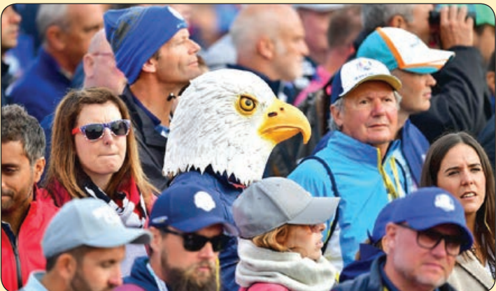
طرفداران مسابقات جهانی گلف، انگلستان

*پیر مرد: مگه نمی بینی بالانش خار چی نوشته WC؟ خب از دلار اثر می گیره! علی مختاری