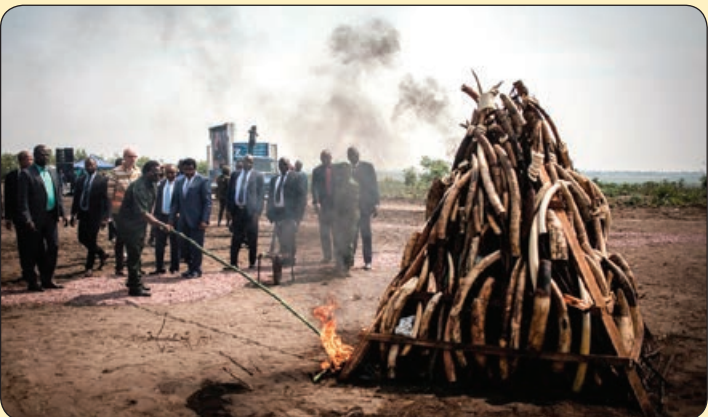
فرانس پرس| رئیس جمهور کنگو یک تن عاج فیل قاچاق کشف شده را آتش می زند

از چاقی رنج می برین؟ اعتماد به نفس ندارین؟ نمی دونین چطوری دل همسرتون رو به دست بیارین؟ دنبال راه های موفقیت هستین؟ خب ما قیلا کلی مطلب راجع به همه این ها داشتیم و الان دوست داریم بدوینم دقیقاً چقدر نظر شما رو تأمین کردیم. پس هر روز از ساعت ۱۱:۳۰ تا ۱۲:۳۰ با ۰۹۴۶۶-۰۵۱۳۷۰ تماس بگیرین و به ما کمک کنین بدوینم چه مطالبی دوست دارین و کدوم مطالب ما خوب یا بد بوده، منتظریم.