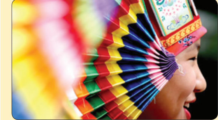
پوشش سنتی تبتی در جشنواره محلی، هندوستان