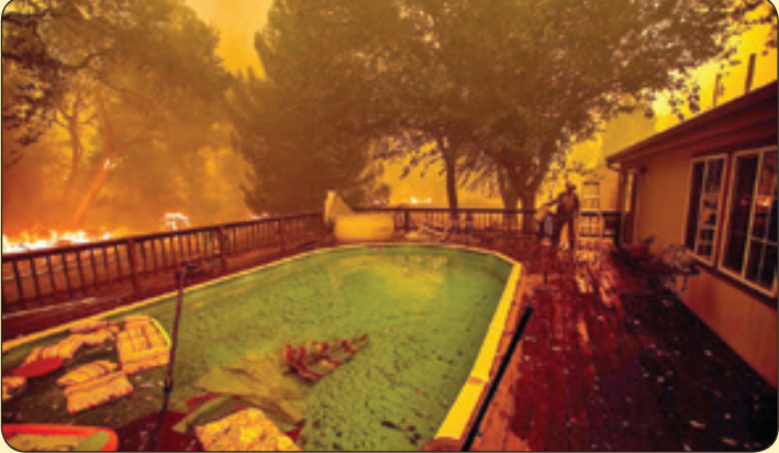
گاردین | پس از آتش سوزی ایالات متحده