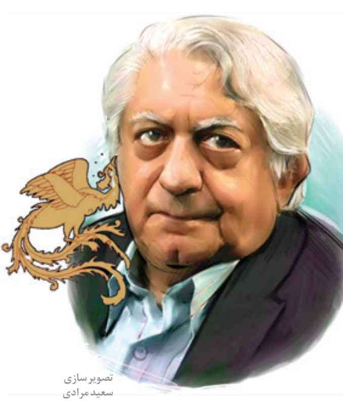
تصویر سازی سعید مرادی