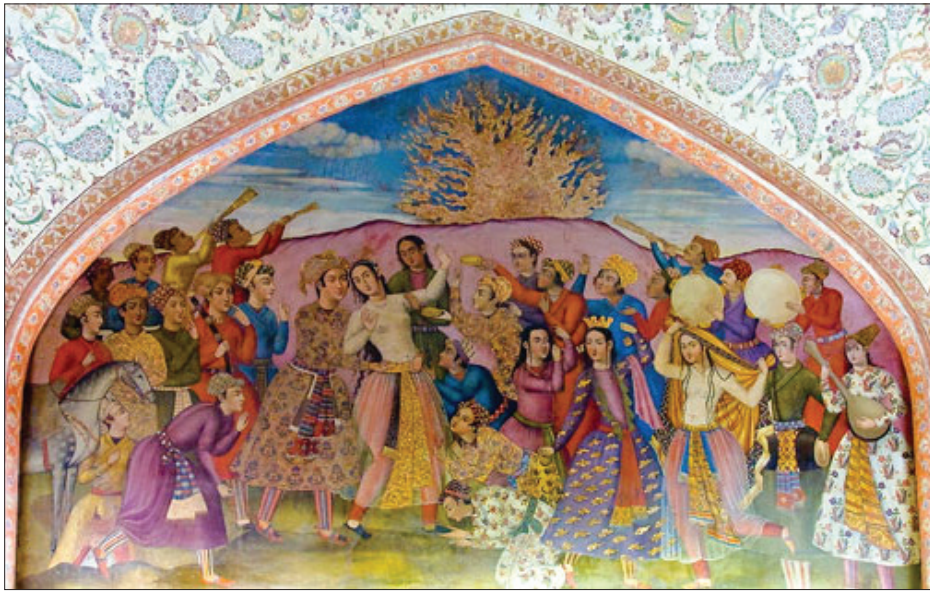
نقاشی آماده کردن شاهزاده هلندی برای قربانی شدن در مراسم سوزاندن جسد همسرش در چهلستون

در برخی منابع، از هنر بروگل به عنوان آخرین مرحله در پیشرفت نقاشی سنتی هلند یاد شده است که در قرن ۱۵ شروع شد. مرحله ای که سنت انتزاع و خیال قرون وسطی را به یک دید تجربی از واقعیت تغییر داد. در واقع بروگل بر تعبیرهای کلاسیک هنرمندان هم دوره اش خط بطلان کشیدو به جای موضوعات اساطیری و صحنه های شاعرانه، به واقعیت روی آورد. در اغلب تابلوهای نقاشی پیتر بروگل، ردپا و دورنمایی از یک زندگی روستایی به چشم می خورد. نقاشی از فرهنگ و رسوم زندگی روستایی و شهری در دوره هم عصران بروگل متداول نبود و او به نوعی پرچم دار این نوع سبک نقاشی در هلند بود. در