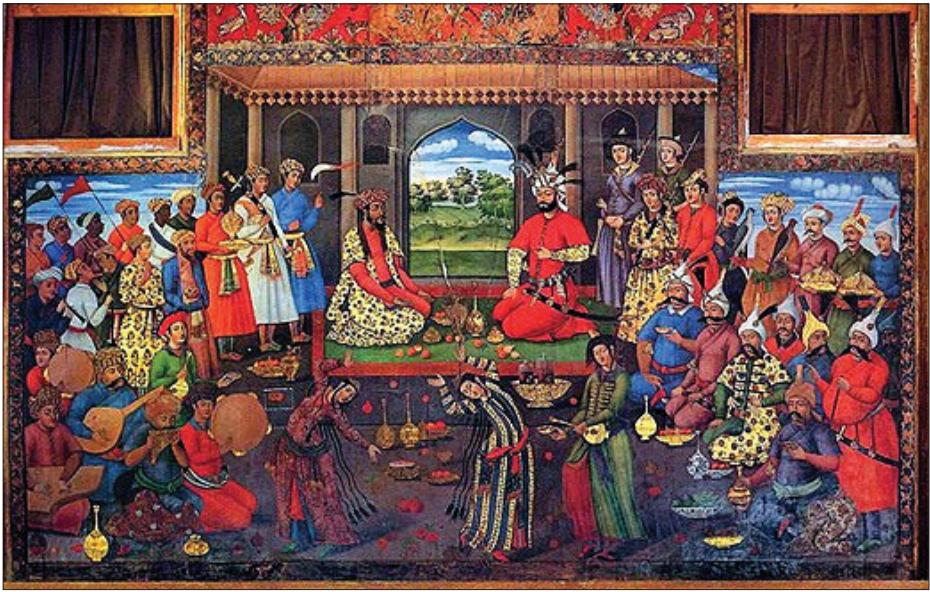
نقاشی بزم پذیرایی شاه تهماسب اول از همایون پادشاه هند که علاوه بر سازها نشان دهنده روابط دو کشور است - چهلستون

اگر گذر تان به اصفهان و کاخ چهلستون افتاده باشد، حتما نگاره های بی نظیر نقش بسته روی دیوارهای کاخ را دیده اید. پادشاهان صفوی که با اهمیت به هنر، اصفهان را به