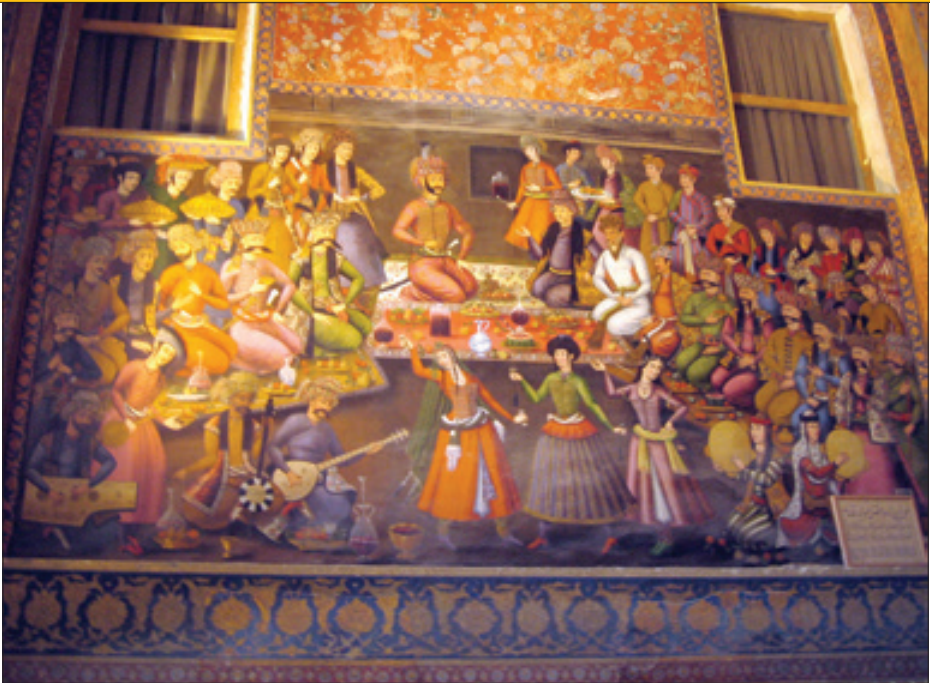
دیوارنگاره بزم در چهلستون اصفهان که سازهای ایرانی را به نمایش می گذارد

یک بوم نقاشی بی نظیر تبدیل کردند، از کاخ چهلستون غافل نشدند. بخشی از نقاشی های این کاخ متعلق به دوره سلطنت شاه عباس دوم است و تلفیقی از سبک رضا عباسی، موسوم به مکتب اصفهان و سبک نقاشی های اروپایی آن دوره را به نمایش می گذارد. جالب این جاست که در دیوارنگاره بزم در چهلستون، سازهای ایرانی به چشم می آید. استاد نعمت ا… ستوده می گوید: «در چهلستون دو تابلوجود دارد که یکی در باره رزم و دیگری در باره بزم است.