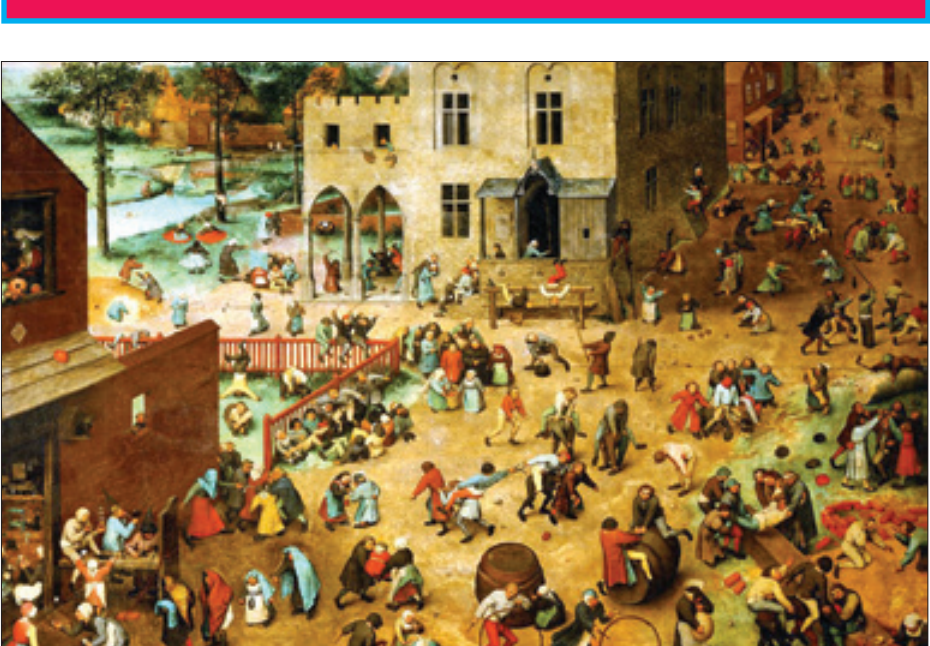
«بازی کودکان»، اثر پیتر بروگل در سال ۱۵۶۰ در موزه وین اتریش

اكرم انتصارى – جایی خواندم پیکاسو در جوانی در بارهٔ نقاشی و وظیفهٔ آن گفته بود: «رِ سالت نقاشی این نیست که دیوار آپارتمان هارا زینت دهد، نقاشی اِیْزاری تدافعی و تهاجمی بر ضد دشمن است.» نقاشی از آداب و رسوم و فرهنگ یک ملت هم مصداق یکی از همین استفاده های تدافعی و درست برای حفظ ارزش های بومی است . به هر حال، هر هنرمندی اِیْزاری دارد . اِیْزار شاعر، شعر و قلمش است، اِیْزار نویسنده ذهن و خیالش، اِیْزار موسیقی دان و خواننده، ساز و صدایش و اِیْزار یک نقاش بوم نقاشی و قلم و مو یک پالت رنگ است . از میان اهالی دنیای ادب و هنر می خواهیم به سراغ نقاش ها برویم . نقاش هایی که دوست داشتند فرهنگ کشور شان را روی بوم بیاورند تا با هر مخاطبی، از هر کجای جهان به زبان نقاشی سخن بگویند و اجازه ندهند تفاوت های زبانی مانع از تِباط شان شود. در ادامه چند تابلوی نقاشی و دیوارنگاره را می بینید و با نقاش هایی آشنا می شوید که با تکیه بر فرهنگ یک کشور، یک تاریخ مصور را خلق کرده اند .