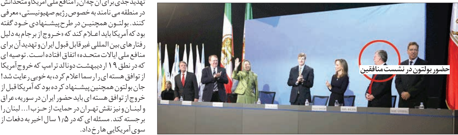
حضور بولتون در نشست منافقین

خوانده می‌شود. او از حامیان سرشناس گروهک تروریستی منافقین است و بارها خواستار بمباران ایران شده ناچایی که یک بار در سال ۲۰۱۵ در مقاله‌ای در نیویورک تایمز گفته بود: «برای جلوگیری از ساخت سلاح توسط ایران، ایران را بمباران کنید» (To Stop Iran's Bomb Bomb). او از حامیان جنگ آمریکا در عراق هم هست و همچنان از این تصمیم اش دفاع می‌کند. بولتون همچنین از اقدام نظامی و تغییر رژیم در سوریه و لیبی نیز همیشه دفاع می‌کند. هفته گذشته گزارشی منتشر شد که بر اساس آن اسناد وزارت دادگستری آمریکا نشان می‌داد، دو نفر از نزدیکان «دونالد ترامپ»، رئیس‌جمهور آمریکا از زمان تحلیف وی دست کم پنج بار با اعضای گروهک تروریستی منافقین دیدار کرده‌اند. این دو نفر «جان بولتون»، مشاور امنیت ملی کاخ سفید و «رودی جولیانو»، وکیل شخصی «دونالد ترامپ»، رئیس‌جمهور آمریکا بودند. بر اساس این اسناد جان بولتون در تاریخ‌های ۳۰ آوریل ۲۰۱۷ (۱۰ اردیبهشت ۱۳۹۶) و ۲ آگوست ۲۰۱۷ (۱۱ مرداد ۱۳۹۶) دیدارهایی با تروریست‌ها داشته است. اظهارنامه مالی که «دفتر امور اخلاقی دولت ایالات متحده آمریکا» (ان‌اچ‌اچ) برای «جان بولتون» تهیه کرده است نشان می‌دهد، وی برای شرکت در نشست گروهک تروریستی منافقین که سال قبل در پاریس برگزار شد، ۴۰ هزار دلار به عنوان «کارمزد سخنرانی» دریافت کرده است.