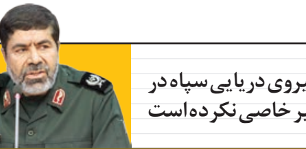
سر دار شریف: گشت‌های نیروی در یابی سپاه در

به همه مسلمانان است و نه متعلق به کسانی که بر آن