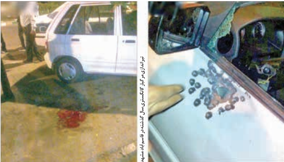
تیراندازی مرگبار گانگستری‌های هالیوودی

است. بنا بر این گزارش، سرخ‌های پلیسی کارآگاهان با راهنمایی‌های قاضی میرزایی به مردی زندانی رسید که برخی ادعاها نشان می‌داد آن مرد زندانی، همان فرد ناشناس است که دستور «هرچشم گرفتن» را صادر کرده است.