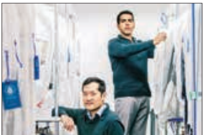
هم‌بنیان‌گذاران استارت‌آپ Rinse در محیط کاری خود در سافرانسیسکو

اگر به دنبال پیاده کردن چنین ایده‌هایی هستید، به دو دلیل لازم است نمونه‌های مشابه را ببینید: اول این که از تجربه آن‌ها بیاموزید و ثانیاً تعداد رقبا را شمرده و تصور درستی از آن‌ها داشته باشید. چرا که کسب و کارهای آنلاین (به طور کلی و در این جا خشک شویی‌ها) محدود به جغرافیا نیستند و با هزینه نه چندان زیاد، می‌توانند حوزه فعالیت خود را نه تنها از یک محله بلکه از شهرها و استان‌ها هم فراتر ببرند. به طور کلی یکی از ویژگی‌های استارت‌آپ را گسترش پذیری می‌دانند. تعداد بسیار زیادی خشک شویی‌های آنلاین در جهان ایجاد شده است که برخی از آن‌ها بسیار ارزشمند هم شده‌اند. با جست‌وجوی عبارت laundry startups می‌توانید برخی از آن‌ها را ملاحظه کنید. اما ایرانی‌ها هم این روزها کم نیستند. زودشور، آبی‌واش، حباب، پلاک‌واش‌لین، پروشور و استارت‌آپ‌های برخی نمونه‌های خشک شویی آنلاین در کشور هستند که مراحل مختلف رشد خود را می‌گذرانند. آنلاین‌ها معمولاً خدمات متنوعی برای انواع لباس، کارگران صنعتی، لباس کودک، لباس‌های ورزشی، بیمارستانی و... در نظر می‌گیرند که باعث می‌شود مشتریان آن‌ها علاوه بر عامه مردم به شرکت‌ها، کارخانجات و... هم گسترش یافته و از این محل درآمدهای پایدار بیشتری کسب کنند.