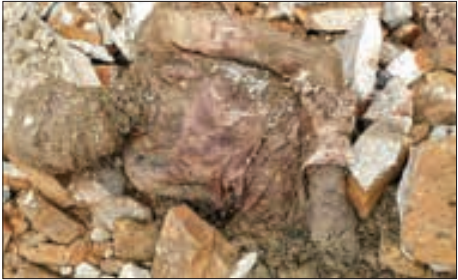
تصویر ششپ به جسد مومیایی کشف شده