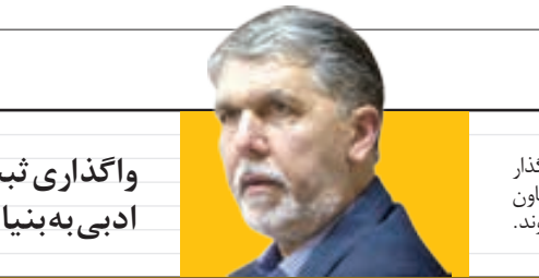
بابالغزیر فرهنگ‌وارشاداسلامی، مسئولیت‌شناسایی، سامان‌دهی‌ومتشکل‌سازی انجمن‌های ادبی‌سر اسر کشور به‌بنیادشعر و ادبیات‌داستانی‌واگذار شد.