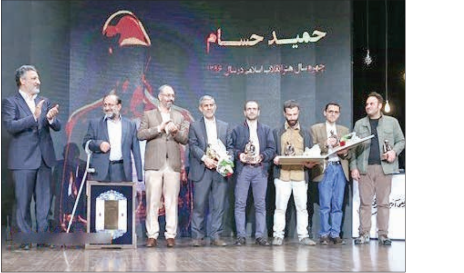
بابالغزیر فرهنگ‌وارشاداسلامی، مسئولیت‌شناسایی، سامان‌دهی‌ومتشکل‌سازی انجمن‌های ادبی‌سر اسر کشور به‌بنیادشعر و ادبیات‌داستانی‌واگذار شد.

وی افزود: فکر می‌کنم ویژگی مهدویان این است که هم حرف خوب می‌زند، هم هنرمندانه حرف می‌زند و هم درم را پای سخشن می‌نشاند.