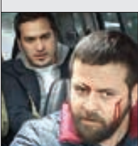
تیم بازیگران کمدی‌های سینمای ایران

پخش یواشکی کمدی‌های سینمای ایران از تلویزیون