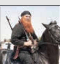
جوزف سلامه، بازیگر لبنانی فیلم «به وقت شام»

« جوزف سلامه » و گفت و گو با رسانه فارسی زبان