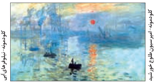
کولورهای بی،نویسنده: سیمون طلوع غریبید