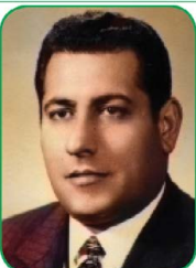
دوازده سال از درگذشت