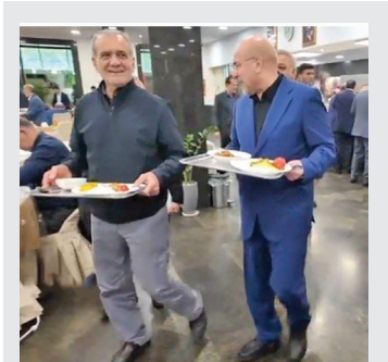
تصویر غیر رسمی و جالب از سروناهار رئیس‌جمهور و رئیس مجلس در حاشیه جلسات رای اعتماد