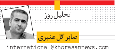
صابر گل عنبری