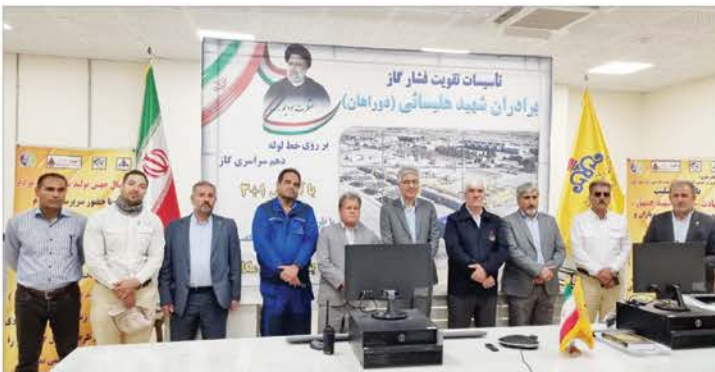
دو ایستگاه تقویت فشار گاز برادران شهید هلیسایی (دوراهان) در استان چهارمحال و بختیاری و شهید شیروانی (پل کله) در استان اصفهان در تاریخ ۱۷ خرداد ۱۴۰۳