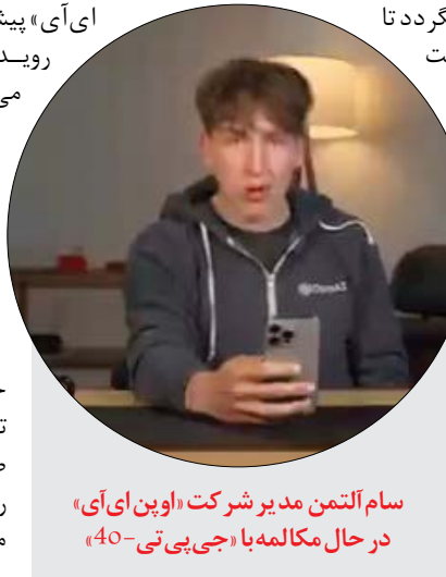
سام آلتمن مدیر شرکت «اوپن‌ای‌آی» در حال مکالمه با «جی‌پی‌تی-40»

تا حل مسئله صحبت می‌کند و از شما می‌پرسد اگر آهنگی آرام‌تان می‌کند اسمش را بگویند تا برای تان از تلویزیون یا اسپیکر پخش کند. بعد هم نور را کم می‌کند که تار سیدن غذای رژیمی، با شنیدن موزیک آرام شوید. شاید چیزی که مرور کردیم نیاز به هوشمند بودن تمام وسایل خانه، اتصال شارب به اینترنت پر سرعت و چند پیش‌نیاز دیگر داشته باشد اما عجیب‌دور از دسترس نیست. درست مثل فیلم‌هایی که روزگاری آن‌ها را در ژانر تخیلی دسته‌بندی می‌کردیم اما حالا بدیهی به نظر می‌رسند.