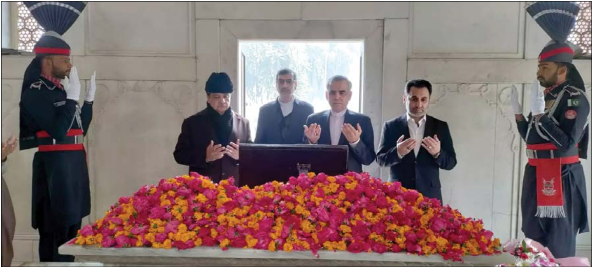
ادای احترام مقام های ایرانی و پاکستانی به مزار علامه اقبال لاهوری

از جایگاه تاریخی والای زبان فارسی در کشور های پاکستان، بنگلادش و هند و نیز: بایسته های احیای آن می گوید