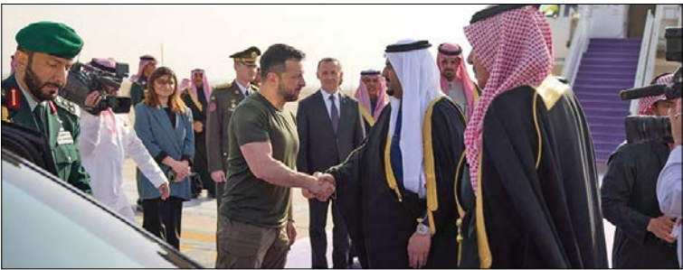
ماکرون: اعزام نیروی زمینی به اوکراین گزینه غیرممکنی نیست

کامیار - تجاوزات و جنایات بی وقفه ارتش رژیم صهیونیستی علیه مردم مظلوم نوار غزه وارد صددو چهل و چهارمین روز پیاپی خود شده است. ارتش رژیم صهیونیستی در اولین دقایق با مدامد دیروز، مناطق مختلف نوار غزه را آماج حملات هوایی، زمینی و دریایی خود قرار داد به طوری که جنوب محله تل الهواد در غرب شهر غزه با توپخانه هدف قرار گرفت و همزمان قایق های توپ دار این رژیم، سواحل غزه را گلوله باران کردند. اشغالگران همزمان با تجاوزات مستمر به نوار غزه، به مناطق مختلف کرانه باختری نیز حمله ور شدند که با مقاومت جوانان مبارز این منطقه روبه رو شدند. از سوی دیگر رژیم صهیونیستی وادی السلوقی و اطراف شهر کحولادر جنوب لبنان را گلوله باران کرد. همزمان، حزب ا... پس از حمله گسترده به پایگاه جاسوسی میرون، پایگاه های رویسات العلم را هدف قرار داد. کانال ۱۳ اسرائیل با اشاره به حملات پیاپی حزب ا... لبنان به سرزمین های اشغالی، افزود: تنها ۴۰ فروند موشک روز سه شنبه از لبنان به سمت پایگاه کنترل و نظارت هوایی راهبردی «میرون» در شمال