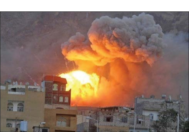
آمریکاوانگلیس حملات هوایی گسترده‌ای به صنعاو چند استان دیگر یمن انجام دادند. انصارا... تاکید کرد که این حملات بدون پاسخ نخواهد ماند

گل‌عنبری -مصری‌ها روزگار سختی را سپری می‌کنند. گرانی کمر آن‌هارا شکست و قیمت‌ها در نتیجه افزایش روزانه نرخ دلار لحظه‌ای تغییر می‌کند. دلار در بازار آزاد کور دزد و به نزدیک ۷۰ لیره رسیده و نرخ دولتی آن ۳۱ لیره است. یک کیلو گوشت (بلدی) ۴۰۰ لیره تمام می‌شود؛ در حالی که حداقل دستمزد ها ۵۲ دلار، میانگین آن نیز حدود ۱۳۰ دلار و تورم ۳۸ درصد است. در حالی مردم صاحب تمدن و شکوه باستانی مصر با حسرت به اقتصاد خیره‌کننده برخی کشور‌های عربی می‌نگرند که تا دیروز نامی از آن‌ها نبود، امارتیس جمهوری مصر برای ساکت کردن مردم، غزه جنگ زده و نبود غذا در آن را برای مصری‌ها یادآور شده و گفته: «اما ما می‌خوریم و می‌آشامیم». مشکل مصر، حکمرانی الیگارشی نظامی و نبود حکمرانی اقتصادی است و الا بهترین روابط را با شرق و غرب دارد و با اسرائیل هم پیمان صلح بسته است. مناسبات خارجی بی‌تنش یا کم تنش شرط لازم توسعه‌است، اما شرط کافی نیست و بدون وجود حکمرانی اقتصادی توسعه محور فارغ از ماهیت اقتدار گرایا دموکراتیک نظام سیاسی هیچ توسعه‌ای رخ نمی‌دهد و هیچ اقتصادی‌کنند. سامان نمی‌یابد.