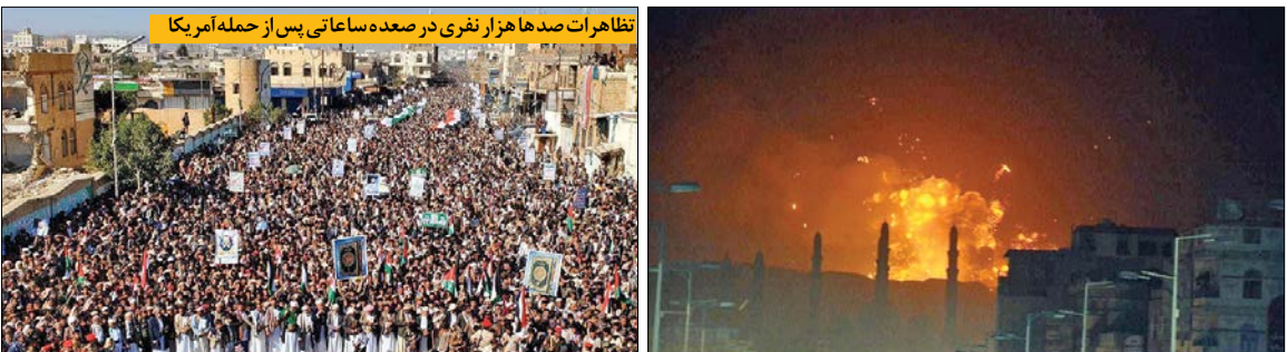
نظارات صد هزار نفری در صعدۀ ساعتی پس از حمله آمریکا