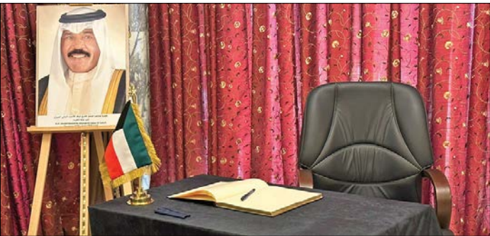
مراسم تشییع پیکر شیخ نواف الاحمد امیر کویت، برگزار شد

گذشته شد. همزمان، نگرانی های بین المللی در باره تلفات غیر نظامیان در حال افزایش است. کاترین کولونا، وزیر امور خارجه فرانسه، که در اسرائیل به سر می برد، خواهان «آتش بس فوری و پایدار» شده است. وزیرای خارجه انگلیس و آلمان نیز خواهان برقراری آتش بس شده اند، مشروط بر این که این آتش بس دائمی باشد. دیوید کامرون و آنالنا بائربوک، وزرای خارجه دو کشور در یک مقاله مشترک که در روزنامه ساندی تایمز بریتانیا چاپ شده است با اشاره به آمار بالای کشته شدن گان در غزه ابراز امیدواری کردند که آتش بس پیشنهادی آن ها منجر به «صلحی پایدار» در منطقه شود. هرچند الی کوهن وزیر خارجه رژیم صهیونیستی مدعی شد، آتش بس در این مرحله هدیه ای برای حماس است. در مقابل، اسامه حمدان، از رهبران حماس با بیان این که گردان های قسام به وعده خود در تبدیل غزه به گورستان نیروهای اشغالگر عمل کرد، اظهار داشت: در برابر نتانیا هو و ستاد ارتش رژیم صهیونیستی گزینه ای جز اعلام شکست در تحقق اهداف شان نمانده است.