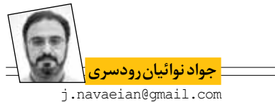
جواد نوابیان رودسری