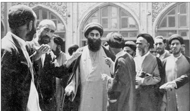
بعد از یکی از جلسات سخنرانی در تهران