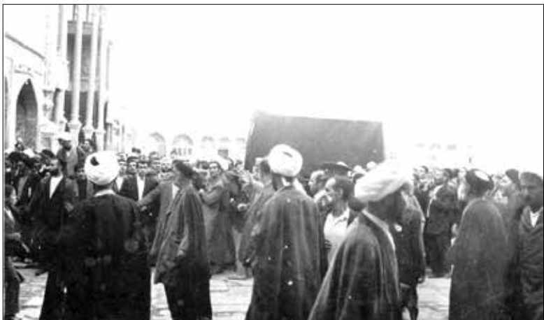
مراسم تشییع پیکر سلطان الواعظین در قم - ۱۸ مهر ۱۳۵۰

فضای اصلی بحث، جایگاه فکری این مدافع و مرزبان حریم تشیع را ابشار کنند.