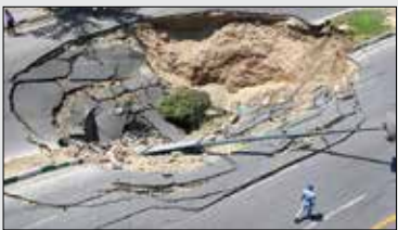
عکس از زمین‌لرزه

طی تاریخ ۱۲۰۰ ساله شهر مشهد، تقریباً تمام نسل‌ها شاهد وقوع زلزله در این شهر بوده‌اند. در این گزارش، به بررسی تاریخ این پدیده طبیعی در شهر مشهد پرداخته‌ایم