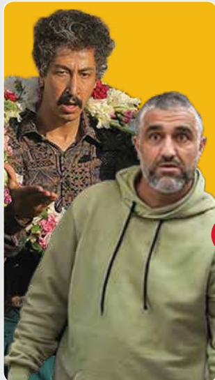
کارنامه سینما در نیمه اول سال درخشش و ناکامی ستاره‌ها

و ناید رئیس فراکسیون ناردی مجلس بر اعمال این افزایش در بخش ناردی