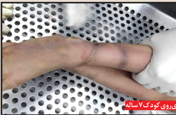
آثار کودک آزاری روی کودک ۷ ساله

طولی نکشید که با حضور مقام قضایی در پزشکی قانونی، علت مرگ کودک مورد واکاوی های دقیق و معاینات پزشکی قرار گرفت و از سوی دیگر نیز قاضی شعبه ۲۰۸ دادسرای عمومی و انقلاب مشهد که به اظهارات ضد و نقیض و گاهی دلسوزانه