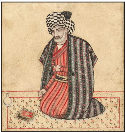
علامه مجلسی – نگاره‌ای از دوره صفویه