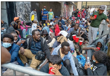
اسکان موقت ده ها مهاجر تازه وارد در هتل روزولت شهر نیویورک آمریکا

رئیس جمهور سابق آمریکا در واکنش به کیفرخواست جدید علیه خود ادعا کرد ممکن است به ۵۶ سال زندان محکوم شود