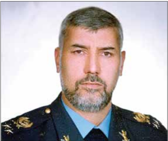
به یاد شهید سر لشکر حسین لشگری ۴۱۰ روز تحمل اسارت