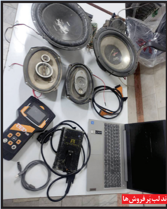
کشفیات پلیس از باند لب پرفروش‌ها