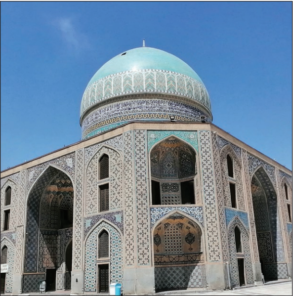
نمایی از بقعه خواجه ربیع در سال ۱۲۸۰ ش/نمایی از بقعه خواجه ربیع در سال ۱۴۰۲ ش (۲۲ سال بعد)

محدوده آرامگاه ربیع بن خثیم در شمال مشهد، بیش از ۱۵۰۰ سال قدمت دارد و شاهد حوادث گوناگونی بوده است، به بررسی تعدادی از آن ها پرداخته‌ایم