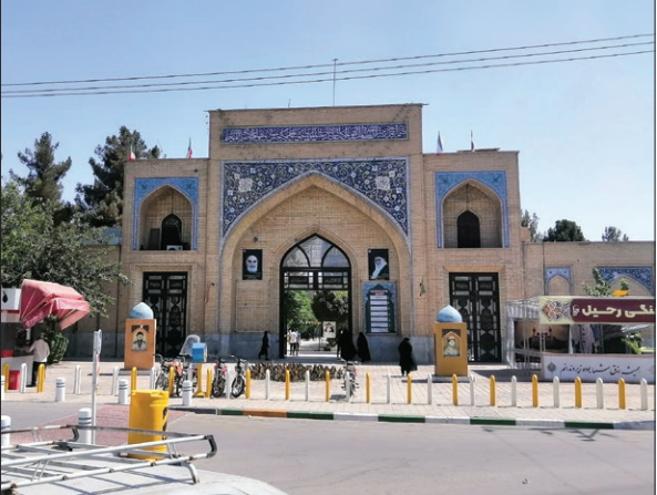
دروازه ورودی باغ خواجه ربیع در سال ۱۲۷۷ ش/دروازه ورودی خواجه ربیع در سال ۱۴۰۲ ش (۱۲۵ سال بعد)