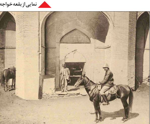
دروازه ورودی باغ خواجه ربیع در سال ۱۲۷۷ ش/دروازه ورودی خواجه ربیع در سال ۱۴۰۲ ش (۱۲۵ سال بعد)

جواد نوائیان رودسری — شاید خیلی ها ندانند که محوطه تاریخی آرامگاه خواجه ربیع، قدمتی بیش از شهر مشهد دارد؛به‌واقع تاریخ آن به‌دوران پیش از اسلام می‌رسد. ربیع بن خثیم، فردی که مقبره موجود در این بنای مُعظم، به او نسبت داده می‌شود، در گذشته سال ۶۳ق است و اگر فرصتی دست داد، در آینده، به زندگی، زمانه و اقدامات او خواهیم پرداخت. باور برخی مورخان این است که محدوده آرامگاه خواجه ربیع، همان محدوده نوغان قدیم است؛ یکی از شهرهای مهم بلوک توس که جمعیت فراوانی داشت و بعد از حمله مغول، به‌تدریج از بین رفت و ساکنانش هم به‌مشهد هجرت کردند. روستای سناباد، یعنی جایی که امام رضا(ع) در آن به شهادت رسید و به خاک سپرده شد، یکی از توابع شهر نوغان بوده است.