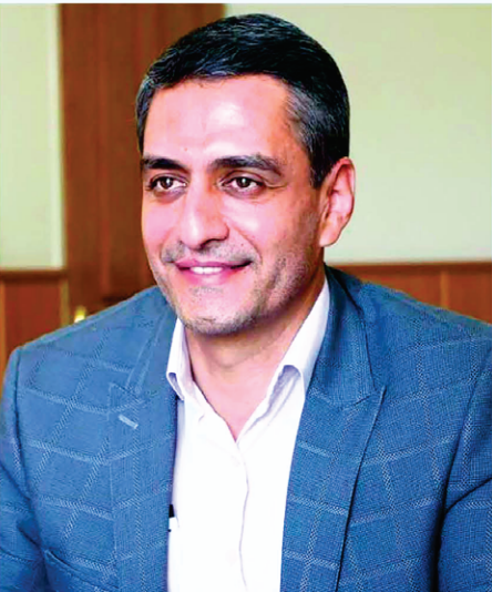
مدیرعامل شرکت توزیع برق اصفهان در حاشیه همایش دانش بهره‌وری انرژی و تقدیر از مشتریان همکار در برنامه پیک مصرف برق، با اشاره به همکاری و

تجارت نیوز - فریدون عباسی دوانی، عضو کمیسیون انرژی مجلس، شایعه افزایش قیمت بنزین را رد کرد و درباره برنامه دولت برای افزایش قیمت بنزین گفت: مطلقاً هیچ تصمیم جدیدی در خصوص تغییر قیمت سوخت خودروهای سواری اتخاذ نشده‌است و این شایعه قطعاً تکذیب می‌شود.