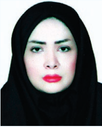
بازگشت همه بسوی اوست