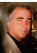
سی و دومین سالگرد مرحوم