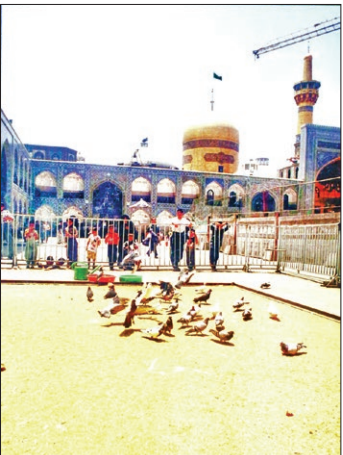
دهه ۱۳۶۰ - جایگاه کبوتران در صحن عتیق