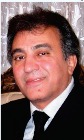
شایان ذکر است بنا بر وصیت ایشان کلیه هزینه های مراسم هفتم و چهلم صرف امور خیریه خواهد گردید.