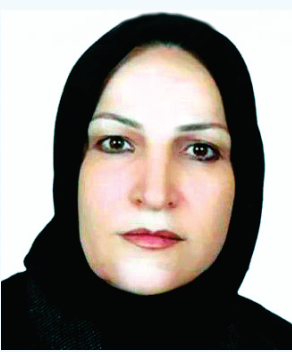
مورخ شنبه ۱۴۰۲/۳/۶ از ساعت ۱۶ الی ۱۸ در مسجد امین واقع در بلوار سجاد میزبان حضور گرم شما هستیم