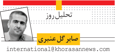
صابر گل عنبری