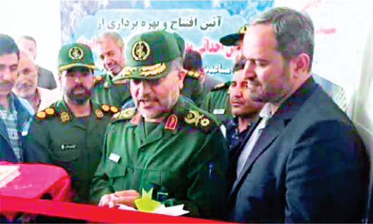
وی افزود : در این مراسم یکی از این واحد ها به خانواده محترم تحت پوشش کمیته امداد تحويل داده شد و با کمک و مشارکت