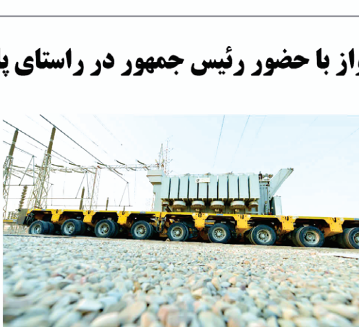
گرد و غبار نیز پایدار بوده و دچار خاموشی نمی شوند. توسعه پست ۱۳۲ به ۳۳ کیلوولت گلستان به ظرفیت ۵۰ مگاولت آمپر