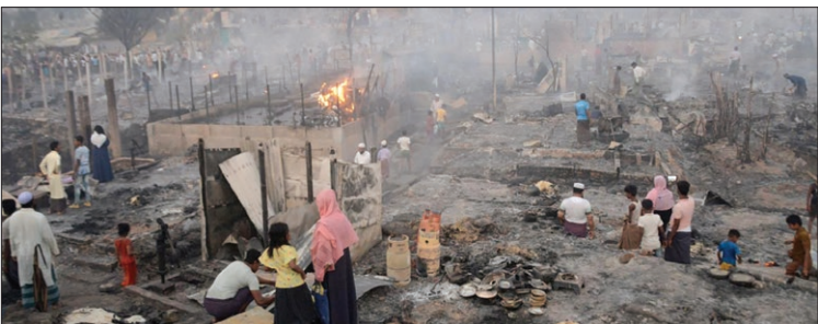
اردوگاه آوارگان روهینگیا در بنگلادش باز هم دچار حریق شد و ۱۲ هزار نفر آواره شدند

نایستد آینده خوبی در انتظار کشور نخواهد بود.» عمران خان آوریل سال گذشته باز دست دادن رای اعتماد در پارلمان از قدرت برکنار شد. او با اتهاماتی مانند تروریسم و فساد با ده‌ها پرونده علیه خود مواجه است. عمران خان چندماه پیش هدف یک ترور نافرجام نیز قرار گرفت و از ناحیه پا مجروح شد. او متهم است هدایایی را که در دوران تصدی خود دریافت کرده و همچنین سود حاصل از فروش آن‌ها را اعلام نکرده است. مقامات و مسئولان دولتی در پاکستان موظف‌اند کلیه هدایای دریافتی را اعلام کنند و تنها مجازند آن دسته از هدایا را که ارزششان از حد مشخصی فراتر نمی‌رود، نزد خود نگه دارند.