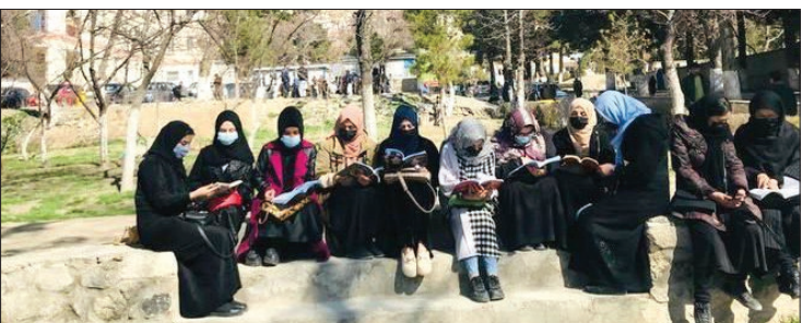
دانشگاه‌های افغانستان بدون حضور دختران بازگشایی شدند

پلیس پاکستان اعلام کرد که برای بازداشت عمران خان، نخست‌وزیر پیشین این کشور به خانه او در لاهور مراجعه کرده اما وی را نیافته است. تلاش ماموران پلیس برای بازداشت عمران خان در حالی ناکام‌مانده صدها تن از هواداران وی در آن ج‌امع شده بودند. عمران خان که به‌همراه هواداران‌ش مدت‌هاست دولت را برای برگزاری انتخابات زود هنگام تحت فشار قرار می‌دهد با چندین پرونده قضایی روبه‌روست. به گزارش یورونیوز، در پیامی که پلیس اسلام‌آباد در توئیتر منتشر کرد، آمده است: «فرمانده تیم اعزامی وارد اتاقی در خانه عمران خان شد که گمان می‌رفت در آن حضور