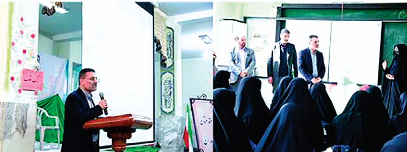
طاغوت و استعمارواستکبارنجات دادند.

در ادامه این مراسم همواره با حضور در تک‌تک کلاس‌های درس دانش‌آموزان با فعالیت‌های متعدد فرهنگی و هنری آشنا شده و به گفتگوی صمیمی با ایشان نشستند.