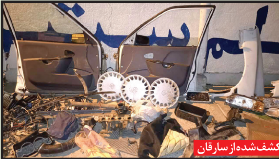
بخشی از قطعات اوراقی کشف شده از سارقان

تحقیقات بیشتر عوامل انتظامی با هماهنگی های قضایی و نظارت مستقیم سرهنگ نگهبان (رئیس پلیس مشهد) برای کشف سرقت های دیگر و دستگیری عاملان مرتبط با تبهکاران مذکور در «عملیات کوهستان» همچنان ادامه دارد.