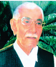
گرامیداشت و یادبود