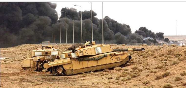
تانک‌های زمین گیر شده چلنجرر انگلیسی از رشیو

جشنواره سنتی دور کردن ارواح شیطانی در «در ازبچه» کراسو/ شینپهوا